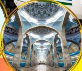
รถไฟฟ้าใต้ดิน