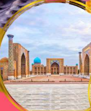
จัตุรัสเรฮิสถาน