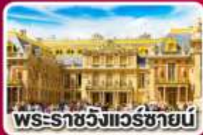
พระราชวังแวร์ซายน์