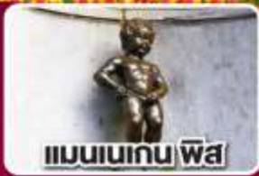
แมนเนเกน ฟิส