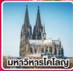
มหาวิหารโคโลญ

เที่ยวเก็บครบ เบเนลักซ์ เบลเยียม เนเธอร์แลนด์ และลักเซมเบิร์ก