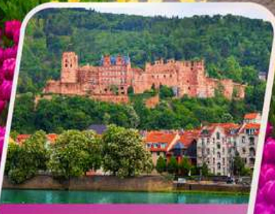
เข้าชมปราสาทไฮเดิลเบิร์ก