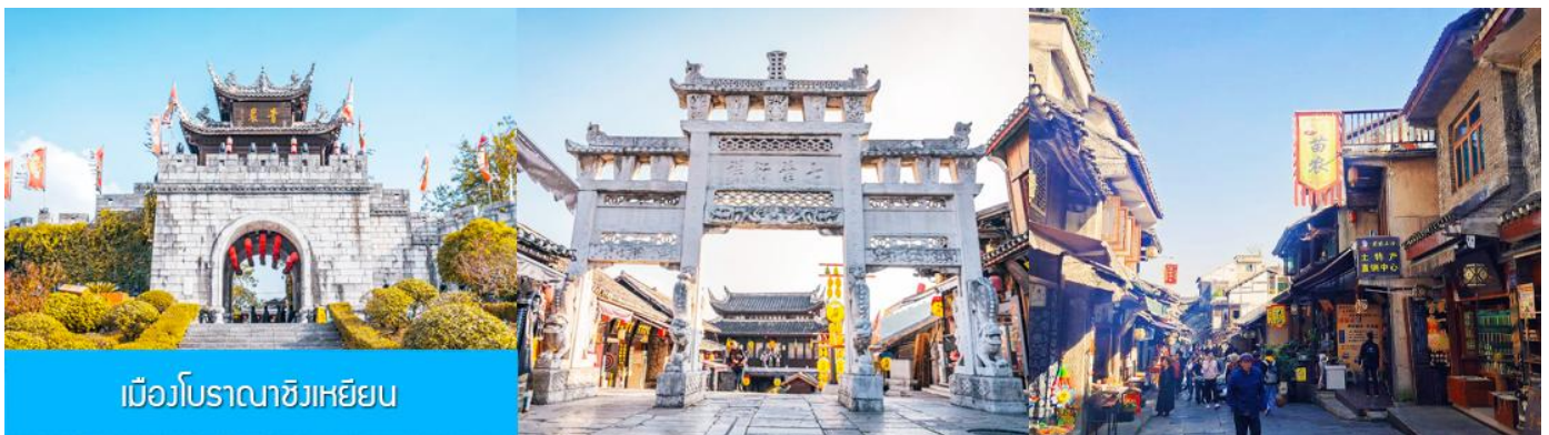
เมืองโบราณชิงเหยียน