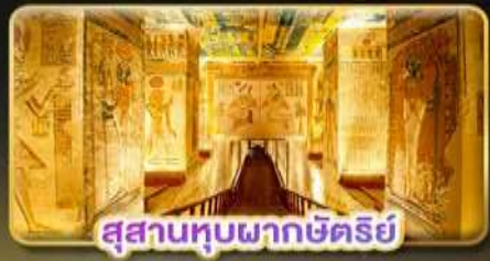
สุสานหุบผากษัตริย์