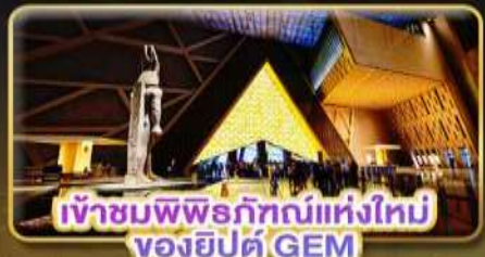
เข้าชมพิพิธภัณฑ์แห่งใหม่ ของยิปต์ GEM