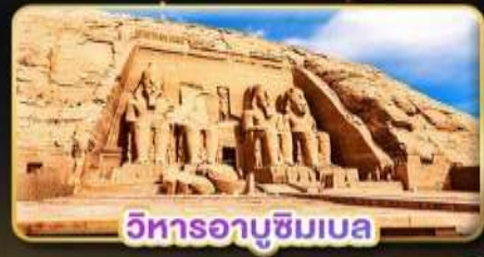
วิหารอาบูซิมเบล

น้ำหนักกระเป๋า 23Kg. (บนระหว่างประเทศ และบินภายใน)