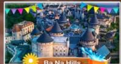
Ba Na Hills