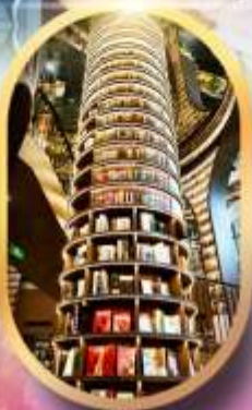
หอหนังสือจางชู่เก๋