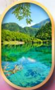
จิ่วจ้ายโกว