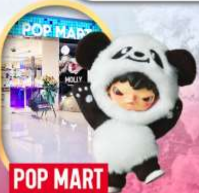
ช้อปปิ้งร้าน Pop Mart