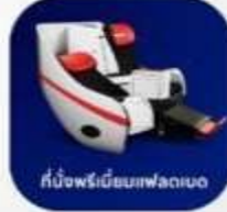
ที่นั่งพรีเมียมเฟลทเบด