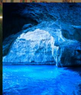
BLUE GROTTO CAPRI