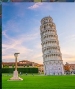
TOWER OF PISA