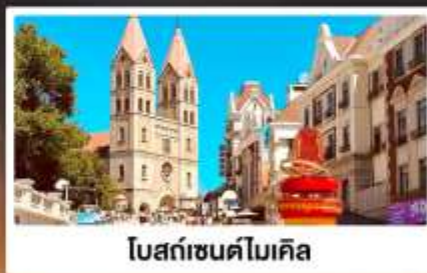
โบสถ์เซนต์ไมเคิล