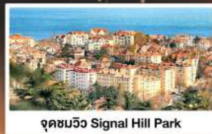
จุดชมวิว Signal Hill Park