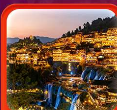
"เมืองโบราณฟูหรงเจิน"