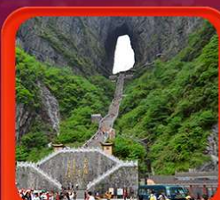
"กำแพงประตูสวรรค์"