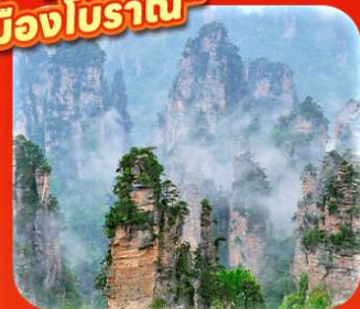
"หุบเขาอวดตาร"