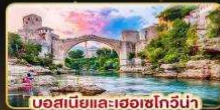
บอสเนียและเฮอร์เซโกวีนา