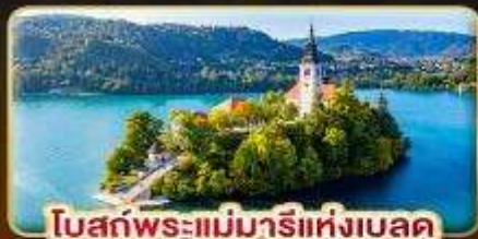
โบสถ์พระแม่มารีย์แห่งเบลด์