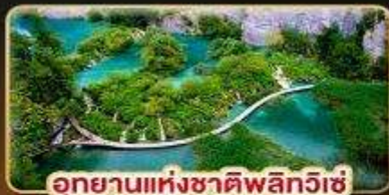
อุทยานแห่งชาติพลิตวิกิ