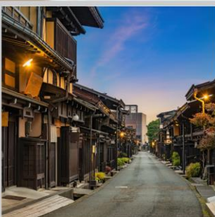
“TAKAYAMA OLD TOWN”