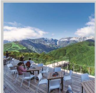
“HAKUBA MOUNTAIN HARBOR”

นำท่านไปโอบกอดธรรมชาติที่ครบครันในที่เดียว “คามิโคจิ” สวิสเซอร์แลนด์แดนญี่ปุ่นเทือกเขาที่ปกคลุมด้วยหิมะสวยงาม ชมความงามของ “ทุ่งพืชมอส ฟุจิชิบะซากุระ” มนต์เสน่ห์..พรมธรรมชาติสีชมพูหลากสีสดใส เปลี่ยนอริยบท “จีนกระเช้าฮาคุบะ อิวะตะเกะ” เพื่อชมวิวพาโนรามาของเทือกเขาแอลป์ญี่ปุ่นกันให้อิ่มใจ สัมผัสกลิ่นอายเมืองเก่า “เมืองทาคายามา” ที่ยังคงอนุรักษ์ความเป็นอยู่ เมื่อสมัยเอโดะกว่า 300 ปี สายช้อปปิ้งห้ามพลาด “คารุอิซาวะ เอ้าท์เล็ต” แลนด์มาร์กของเมืองคารุอิซาวะ และ “ย่านชินจุกุ” แห่งเมืองโตเกียว ชมความงามกับเส้นทาง “เจแปนแอลป์ (ท่าแพงหิมะ)” สุดยอดของการท่องเที่ยวที่ถูกขนานนามว่า “หลังคาแห่งญี่ปุ่น”