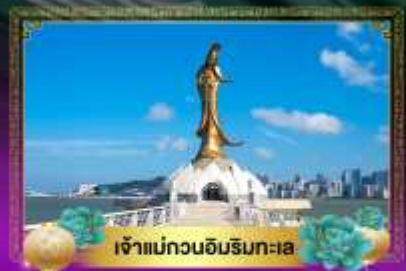
เจ้าแม่ทวนอิมริมทะเล