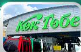
ซิมบูตอกเบชมวิวอัลมาตี

นั่งกระเช้าซิมบูลัค-ทะเลสาบโคลไซ-โบสถ์เซมคอฟ