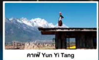
คาเฟ่ Yun Yi Tang