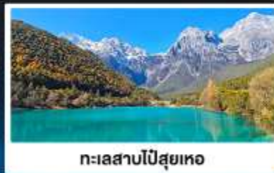
ทะเลสาบโป๋สือเหอ