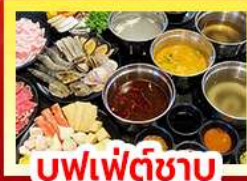
บุฟเฟ่ต์ซาบู