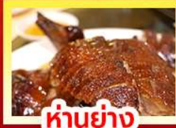
ห่านย่าง