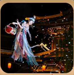
“เมืองโบราณลั่วอี้”

ชมกำแพงหิมิน มรดกโลกที่เมืองลั่วหยาง • สุสานจีนซีฮ่องเต้ • ศาลเจ้ากวนอู วัดเส้าหลิน + ป่าเจดีย์ + ชมโชว์กังฟู • เมืองโบราณลั่วอี้ • อุทยานหยุนไท่ซาน เจดีย์ห่านป่าใหญ่ • ถนนวัฒนธรรมต้าถัง • ถนนคนเดินอิสลาม • จัตุรัสหออระขิง