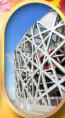
ผ่านชมสนามกีฬาโอลิมปิก