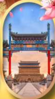
ถนนคนเดินเจียมเหมิน