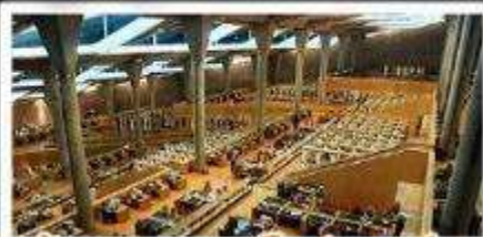
ห้องสมุดอเล็กซานเดรีย