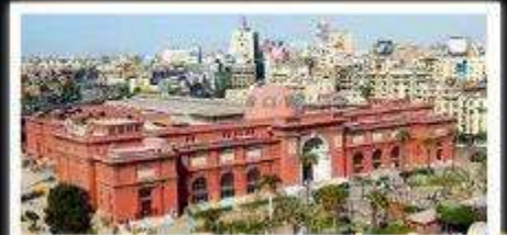
พิพิธภัณฑ์สถานแห่งชาติอียิปต์