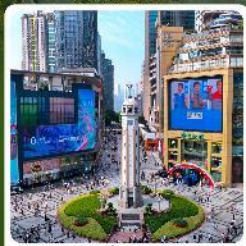
ถนนเจียฟางเป่ย์