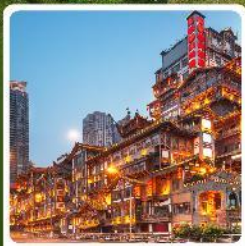
หงหยาดิง