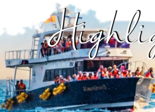
RAUSU WHALE CRUISE