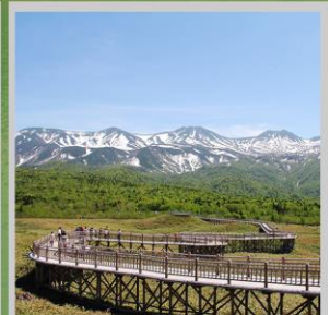
"SHIRETOKO 5 LAKES"