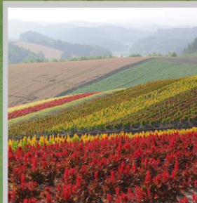
"SHIKISAI NO OKA"