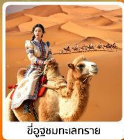
ขี่อูฐชมทะเลทราย