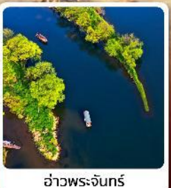
อ่าวพระจันทร์