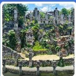
ปราสาทหินเย่หลางกู่

● โฮเทล น้ำตกหวงกั๋วซู่ น้ำตกที่ใหญ่ที่สุดของจีน แหล่งท่องเที่ยวระดับ 5A ชมความสวยงาม หมู่บ้านเวียงจางัย หมู่บ้านจีนโบราณ