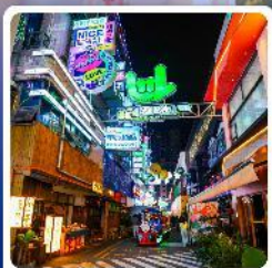
ถนนคนเดินซินหยุน