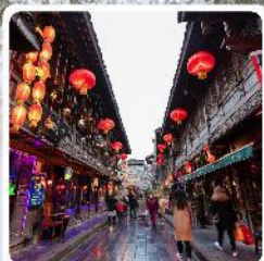
ถนนโบราณจีนหลี