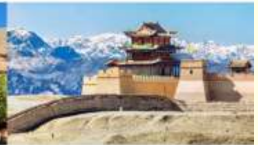
กำแพงเมืองจีน ด่านเจียยวี่กวน

*ทางบริษัทฯ ขอสงวนสิทธิ์ในการสลับโปรแกรมทัวร์ตามความเหมาะสมขึ้นอยู่กับสถานการณ์หน้างาน โดยคำนึงถึงผลประโยชน์ของลูกค้าเป็นสำคัญ