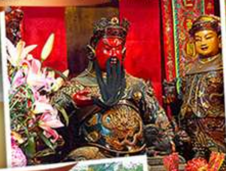
วัดหลินฟาง