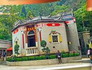
องค์อ้อยส้ม