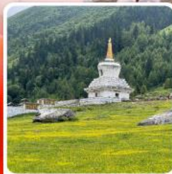
ภูเขาสีครุณี