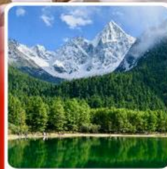
อุทยานบึงเพ็ญโก