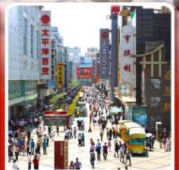
ช้อปปิ้งถนนคนเดินซุนซีลู่