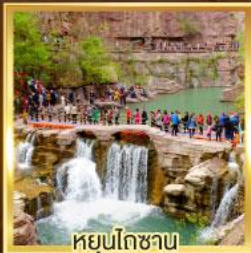
หยุ่นโกซาน