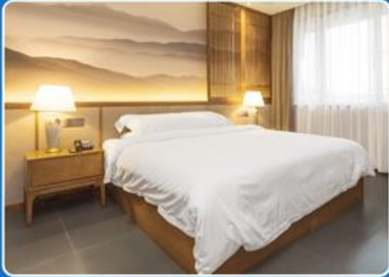
👤 SINGLE (SGL)