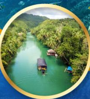
ส่องเรือแม่น้ำไลบ็อก