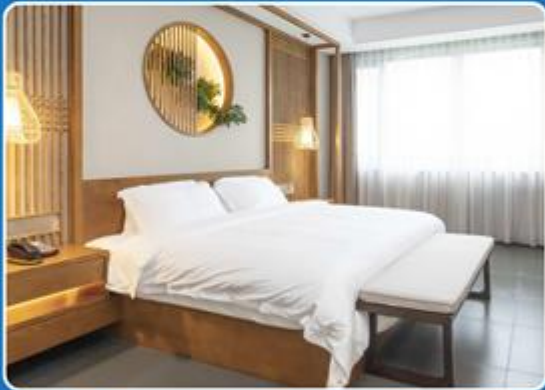
👤👤 DOUBLE (DBL)