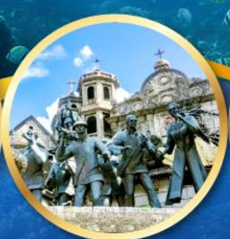
อนุสาวรีย์มรดกแห่งเซบู