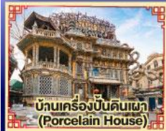
บ้านเครื่องปั้นดินเผา (Porcelain House)