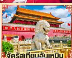
จัตุรัสเทียนจันเหมิน