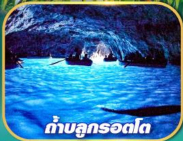
ถ้ำบลูกรอดโก