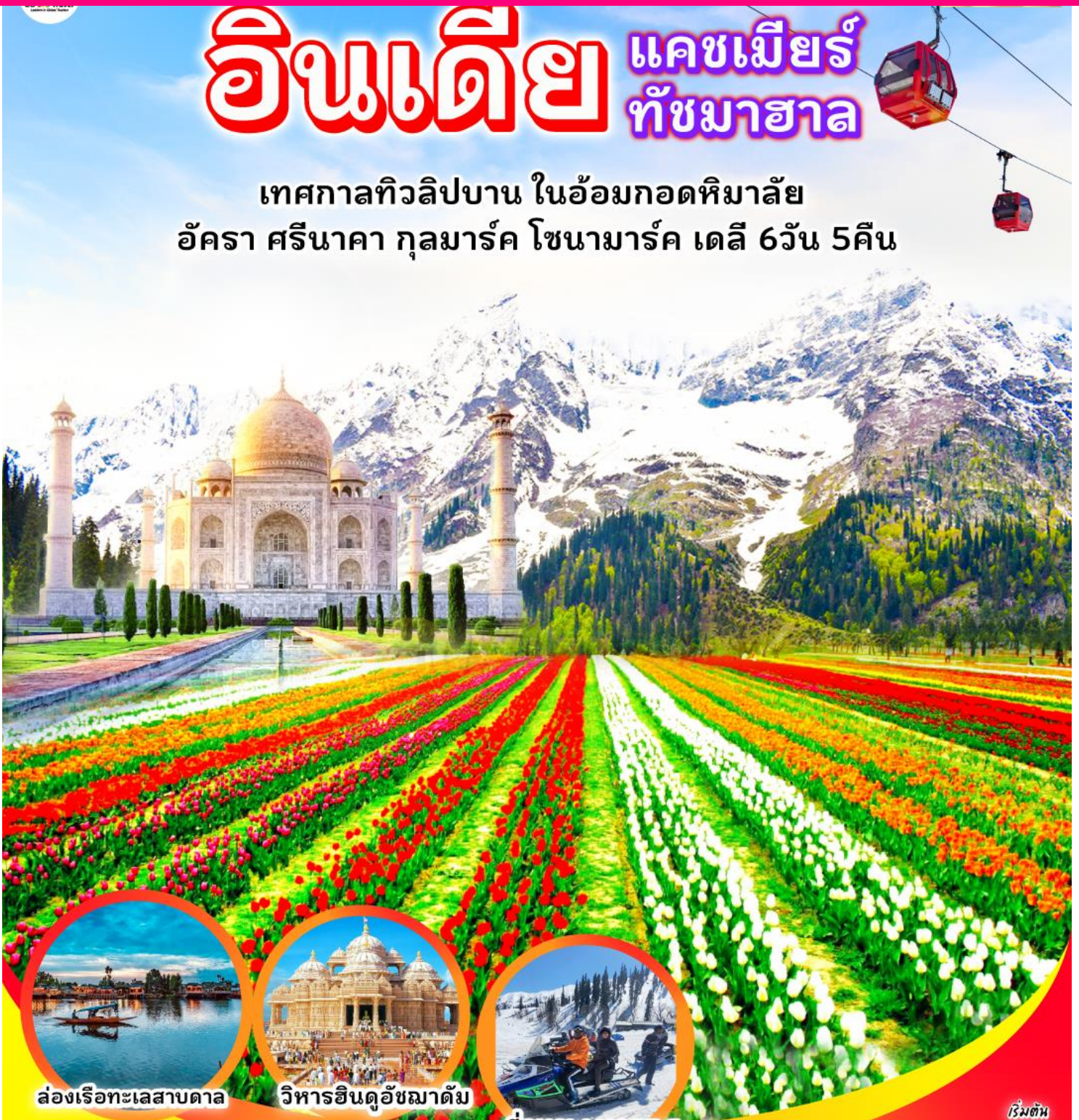
ล่องเรือทะเลสาบดาล

เทศกาลทิวลิปบาน ในอ้อมกอดหิมาล้ำ อัครา ศรีนาคา กุลมาร์ค โซนามาร์ค เดลี 6วัน 5คืน