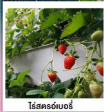
โรสครอว์เบอร์รี่