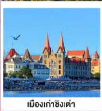
เมืองท่าชิงเต่า