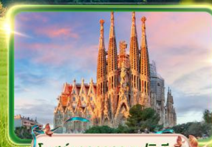
โบสถ์ซากราดา แฟมิลีย