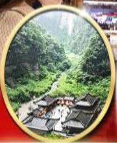
อุทยานหลุมฟ้า สะพานสวรรค์