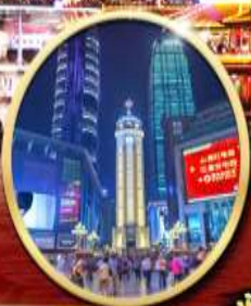
ถนนคนเดินเจี๋ยฟางเป่ย์