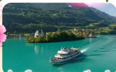
ล่องเรือทะเลสาบเบรียนซ์

พิชิตยอดเขาชุนเนกกา 1 ในเขาที่สวยงามที่สุดเมืองเซอร์แมท