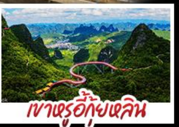
เขาตรู้อีกุ้ยหลิน