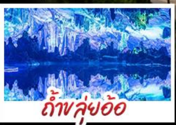
ถ้ำขลุ่ยอ้อ