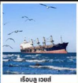
เรือลู เวย์ส์