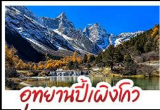
อุทยานป่าเข็ญทิว

อุทยานสี่ฤดู - อุทยานป่าเข็ญทิว - อุทยานจิวจ้ายทิว รถไฟความเร็วสูง - EASTERN SUBURB MEMORY ถนนโบราณความจำ - วัดต้าฉือ ช้อปปิ้งย่านคิง ถนนไท่กู่หลี่ + ถนนซุนซีลู่