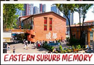
EASTERN SUBURB MEMORY