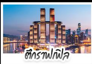
ตึกรางฟลิค