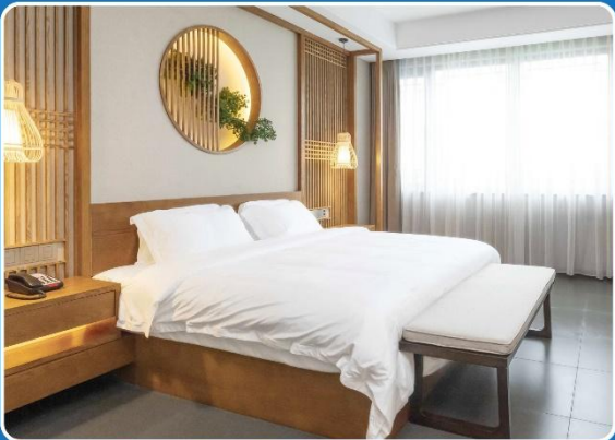
👤👤 DOUBLE (DBL)