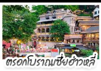
ตรอกโบราณเซี่ยฮ่าวหลี่