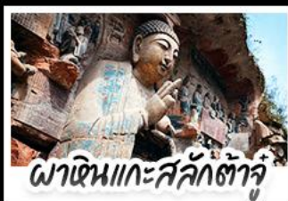
พินหนะสลักคำจู๋