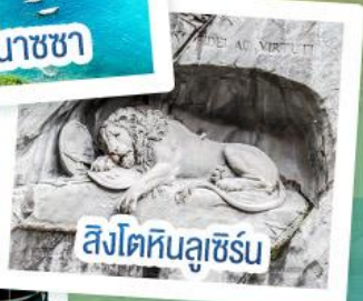
สิงโตหินลูซิิร์น