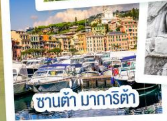
ซานต้า มารีตา