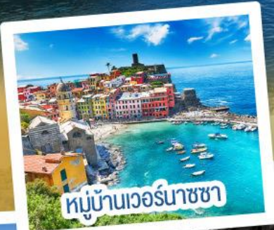
หมู่บ้านเวอร์นาซซา