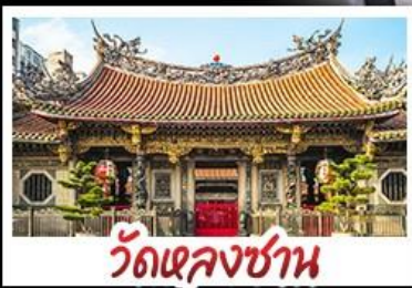
วัดเจหลงซาน