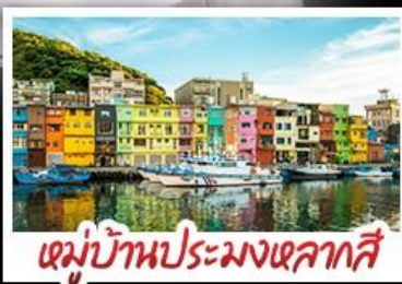
หมู่บ้านประมงเหลากสี