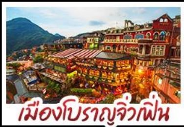
เมืองโบราณจิ่วเฟิ่น