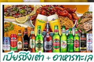
เบียร์ชิงเต่า + อาหารทะเล