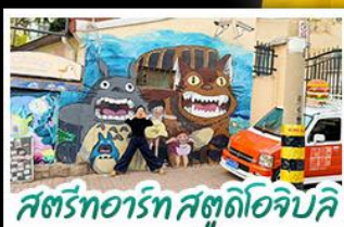
สตรีทอาร์ต สตูดิโอจิบลิ