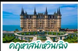
ฤดูหาสมบัติหวิงเจิง

เมืองเก่าชิงเต่า - ฤดูหาสมบัติหวิงเจิง เบียร์ชิงเต่า + อาหารทะเล สตรีทอาร์ต สตูดิโอจิบลิ