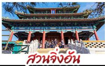
สวนจิ่งอัน