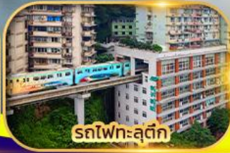
รถไฟทะลุตึก