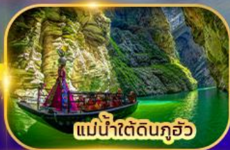
แม่น้ำใต้ดินกุ้ยโจว