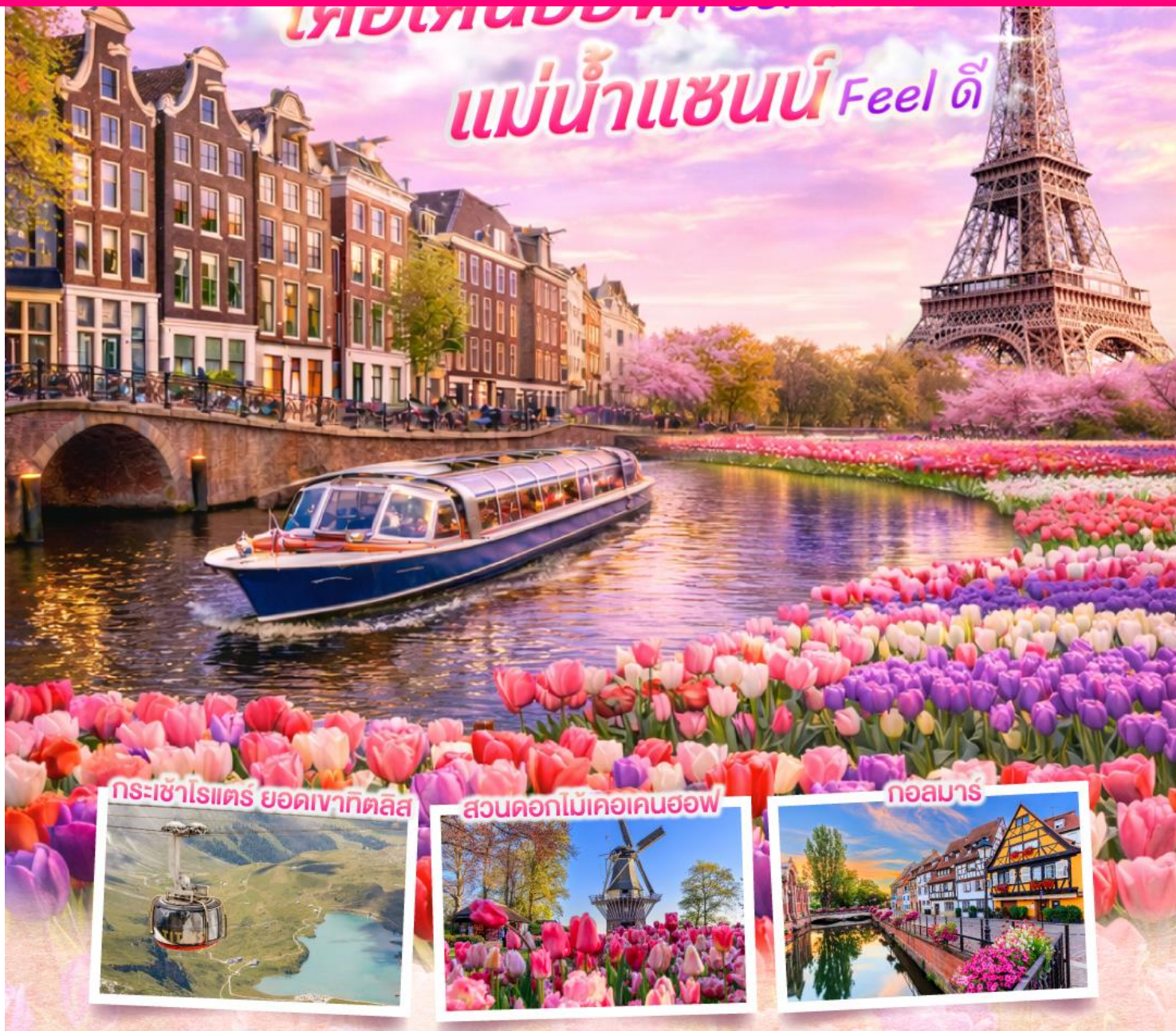
กระเช้าไรเตร ยอดเขาทิตลิส