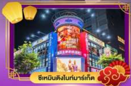
ซีเหมินดิงไนท์มาร์เก็ต