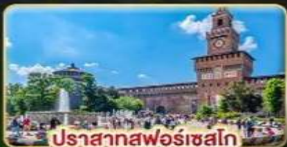
ปราสาทฟอรัซโก

📅 เดินทาง : 28 พ.ค. - 06 มิ.ย. | 05-14 ส.ค. 15-24 ต.ค. 69